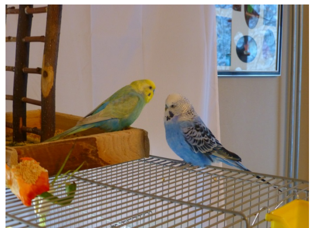
Två av undulatkolonin.