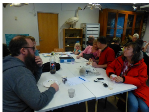
Ett glatt gäng