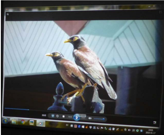
Bilder från Medhs filmer